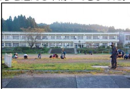
【朝日を浴びながら愛校作業】

保護者の皆さん、4年生以上の子供たち、校区コミュニティの皆さんに御協力をいただきました。いつも学校のためにありがとうございます。